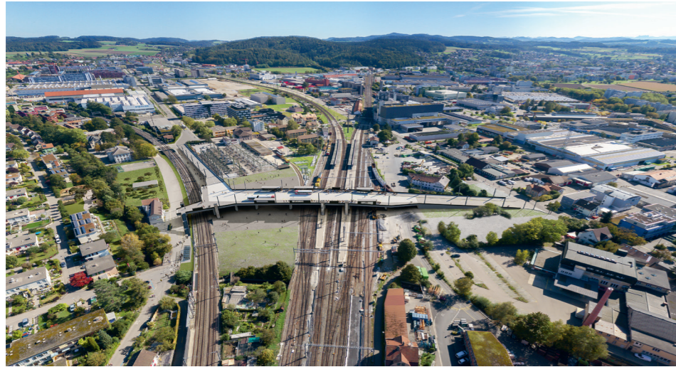
Visualisierung Brücke beim Bahnhof Grüze

Im Rahmen des städtischen Gesamtverkehrskonzepts soll beim Bahnhof Grüze eine barrierefreie Busverbindung von Neuhegi in die Stadt entstehen. Eine 450 Meter lange Brücke über die Bahngeleise soll dabei als Verkehrsdrehscheibe dienen, mittels derer die S-Bahn mit den Linien des Stadtbusses verknüpft werden kann.